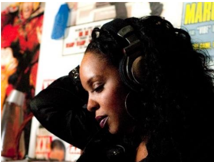
【MC 饒舌 | 講師：Rah Digga】

Rashia Tashan Fisher (藝名：Rah Digga) 是一名美國饒舌歌手兼演員。她曾是由饒舌歌手 Busta Rhymes 領軍的 Flipmode Squad 嘻哈組合的老班底，以此身分最為歌迷所樂道。Rah Digga 的出道專輯《Dirty Harriet》(2000年)曾在 Billboard 200 強榜單衝上前 20，第二張專輯《Classic》則在 2010 年發行。此外，Rah Digga 還曾在 2001 年上映的恐怖電影《惡靈 13》(Thirteen Ghosts) 飾演 Maggie 一角。