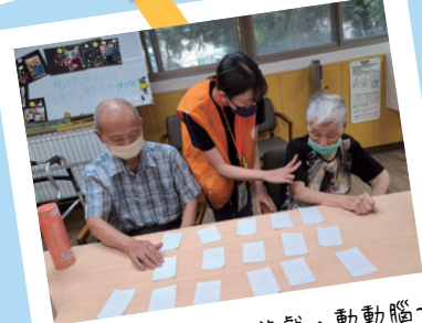
跟著長輩一起玩遊戲，動動腦~ 玩到差點忘記要吃飯XD