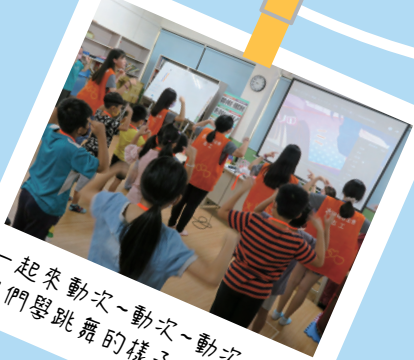
一起來動次~動次~動次~ 他們學跳舞的樣子太可愛啦!

從身心障礙者就學、就業等權益倡導，進而到發展遲緩兒童的早期療育服務、高齡長者的照護.....等，提供身、心、靈的全人社會福利服務，讓福音與福利得以實踐。