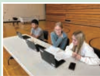
▲線上交流的美國同學