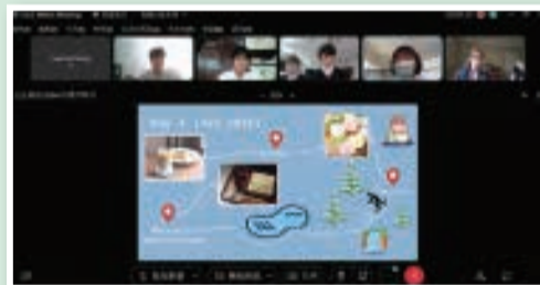
▲Data Science Contest