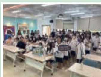
▲彰化劇場藝術節講座