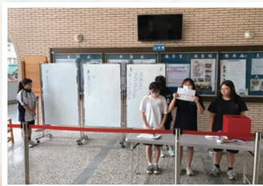
▲0424班聯會正副主席選舉