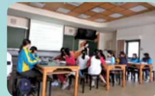
▲跨領域課程體驗：歷史老師為學生介紹彰女校史。

說明 | 2022學術試探列車彰女號於111年4月9日(星期六)於彰化女中辦理，今年活動分為上午跨領域課程體驗以及下午課程實作闖關活動。今年度參加的彰化區國中學員一共有29校，共166位學員參與，活動內更加入近120位高一生力軍，這群小隊輔及課程設計闖關關主們分別來自本校113、114、115三個特殊班同學，由學姊們一同帶領國中學員體驗彰化女中的特色課程，過程饒富樂趣，寓教於樂，體現彰女在108新課綱的嶄新課程設計。