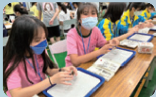
▲生物組課程實作闖關活動：體驗實驗室解剖蛤蜊。