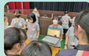
▲科普雙語組實作闖關活動：以英文口說講解科普及化學概念，再引導實作。