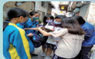
▲跨領域課程體驗：地理實察，讓學生實地走訪彰化市小西街。