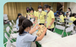
▲物理組課程實作闖關活動：彈珠台練習平衡實驗。