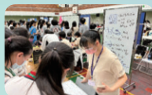
▲國文組課程實作闖關活動：以題辭典故嘗試語句結構設計。