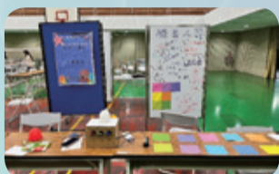
▲機器人組課程實作闖關活動：以程式設計讓學生體驗顏色辨識度。