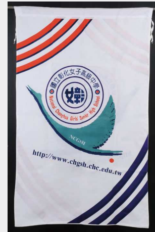
現今 LOGO 大布旗